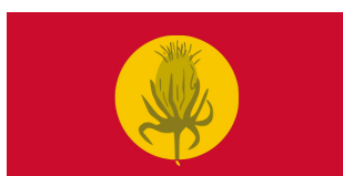
Вевчани / Vevchani