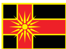
Другово / Drugovo