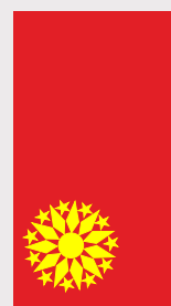
Кривогаштани / Krivogashtani