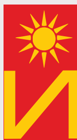
Илинден / Ilinden

Знамињата се исцртани од Стојанче Величковски, според најдобрите достапни информации. Официјалните еталони се чуваат во регистрот на Министерство за локална самоуправа и сè уште не се достапни за јавност. The flags have been redrawn by Stojance Velickovski according to the best available information. The official etalones are held in the Register at the Ministry for Local Self Government and are not available to the public.