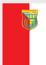
Кичево / Kichevo