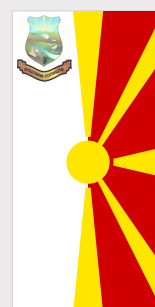
Сопиште / Sopishte