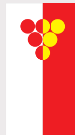
Кавадарци / Kavadarci