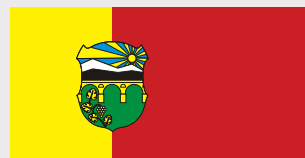
Бутел / Butel