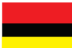
Тетово / Tetovo