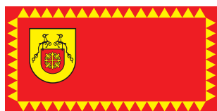
Ранковце / Rankovce