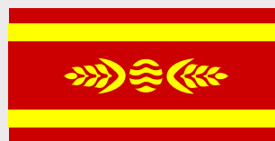
Кочани / Kochani