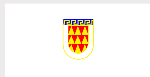
Битола / Bitola