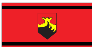
Арачиново / Arachinovo