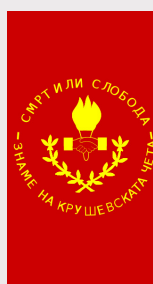
Крушево / Krushevo