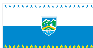
Маврово-Ростуше / Mavrovo-Rostushe