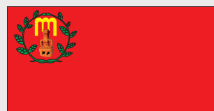
Гази Баба / Gazi Baba