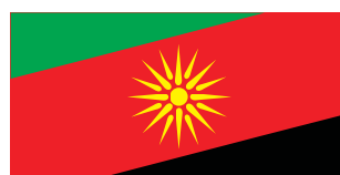
Македонска Каменица / Makedonska Kamenica