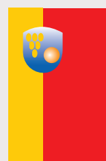
Росоман / Rosoman