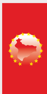
Сапај / Saraj