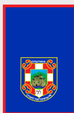
Старо Нагоричане / Staro Nagorichane