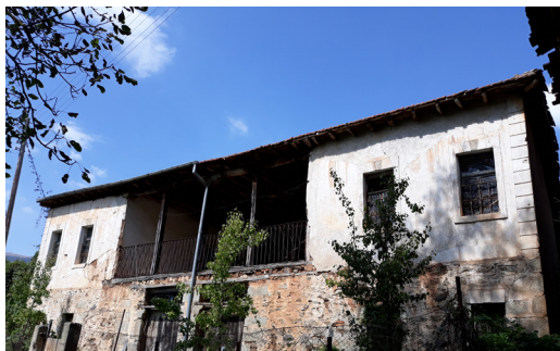
Куќата на Нумчеви во Кономлати/ House of the Numchev in Konomlati

Кономлати е револуционерно село; во Илинденското востание, сите мажи на возраст над 15 години (вкупно 366 мажи) се приклучиле во формираните комитски чети (Хроники 2018, 21 и 55), а за време на Граѓанската војна во Грција, во редовите на ДАГ се приклучиле вкупно 367 мажи и жени (Хроники 2018, 94). Во оваа