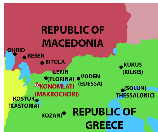
Кономлати во поширокиот регион/ Konomlati in the wider region

in the territory of Koreshta (Kostur region was divided into seven narrower areas-counties (zhupi)) in which, besides Konomlati, there are 25 other villages (Васиљевиќ 1928, 86). Konomlati is located in a valley between Mount Vicho and its tributaries, at 950 meters above sea level. The village is of compact type and is divided into three neighborhoods