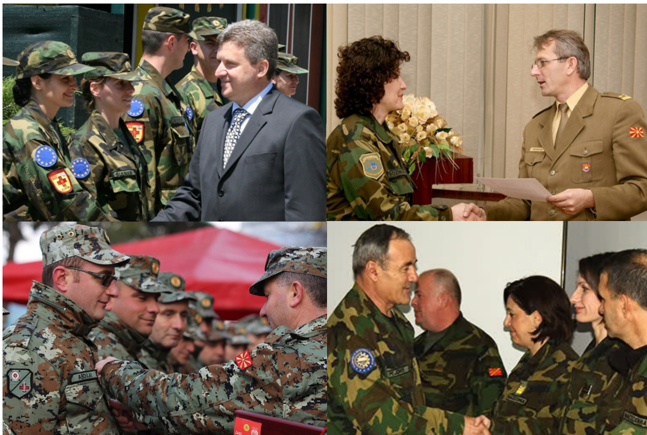
Дел од амблемите на Командата/Бригадата за логистичка поддршка на униформата на припадниците на АРМ Part of the emblems of the Command / Brigade for logistical support of the uniform of the members of ARM