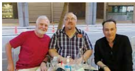
Средбата во Атина/Meetings in Athens