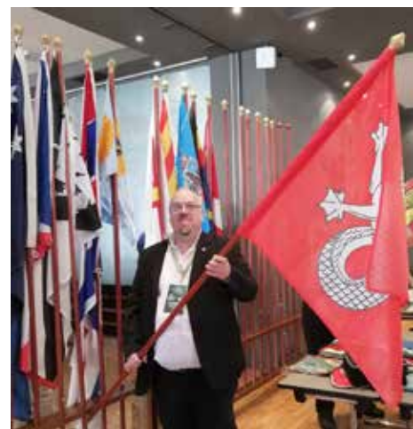
Конгресот / The Congress