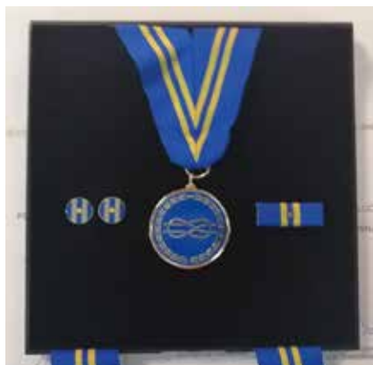
Медалот /The Medal

appearances in written and electronic media.