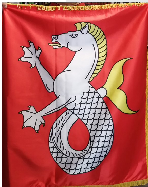
The flag of MHS