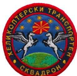
сл./ fig. 24

The insignia of the Training Command is circular with yellow fimbriation, divided into two circles. The first circle is dark blue; in the upper part is the semicircular yellow inscription “КОМАНДА ЗА ОБУКА” (TRAINING COMMAND), in the lower part are embroidered seven stars. The second circle is green, on which is a shield depicting the state flag. On right of the shield is an open