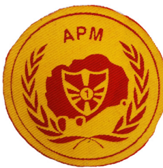
сл./ fig. 15