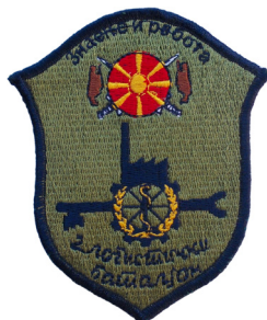
сл./ fig. 29