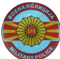
сл./ fig. 17

2000. The emblem of the Brigade is a brown shield with dimensions of 9.5 x 7.5 cm. In the upper part, the word “MACEDONIA” is embroidered with yellow thread on a semicircular light blue ribbon, below it the flag of the Republic of Macedonia is embroidered, and below it in the central position is the outline of the territory of the Republic of Macedonia in red. A white border marker is woven in the middle, along with the inscription “RM”. Above the outline, white and brown mountain peaks are woven and in the background is a light blue sky. The red inscription “ARM” is woven in the sky, and to the left and right of the outline a yellow wreath is woven. (Fig. 14).