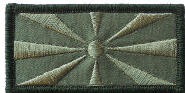
сл./ fig. 38