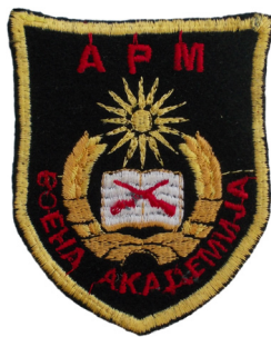
сл./ fig. 8

венец од житно класје во темножолта и светложолта боја, обвиткан во лента на долните краеве, а меѓу врвовите на класјето е 16-кракото сонце од државното знаме, извезено во жолта боја. Над сонцето со црвен конец е извезено „АРМ“, а околу венечот во полукруг е извезено „ВОЕНА АКАДЕМИЈА“. По целата должина, амблемот е обрабен со раб во жолта боја, широк 0,3 см. (сл. 8)