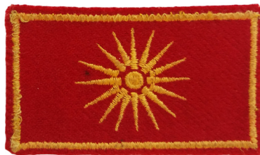
сл./ fig. 3