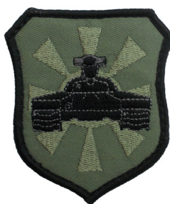
сл./ fig. 40