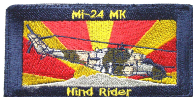
сл./ fig. 26