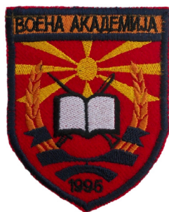
сл./ fig. 12