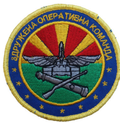
сл./ fig. 23

Ознаката на Транспортниот хеликоптерски ск-