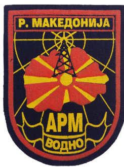
сл./ fig. 18

Амблемите на Инженерскиот полк се изработуваат и на светлосива основа