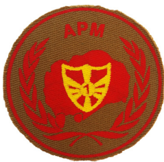
сл./ fig. 16