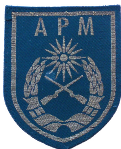
сл./ fig. 6