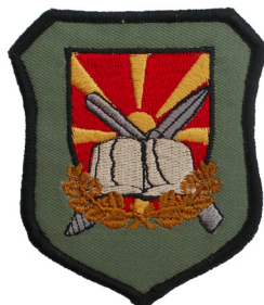
сл./ fig. 36

The insignia of the Cadets Training Center is a green shield with black fimbriation. In the center of the shield is a triangular shield with the Macedonian flag, over which appear the following elements from left to right: a sword and a gun in dark brown color, over them is an open light-brown and white book and below it is a gold oak wreath with acorns. (Fig. 36)