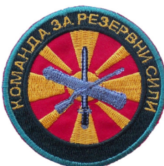
сл./ fig. 41