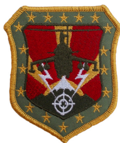
сл./ fig. 30