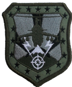
сл./ fig. 31

The insignia of the Training and Doctrines Command is circular with yellow fimbriation, divided into two circles. The first circle is dark gray; in the upper part are inscribed