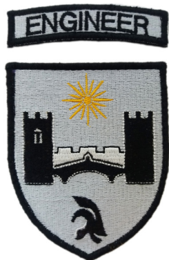
сл./ fig. 22

unique insignia of Army membership is printed. (Fig. 17)