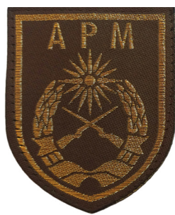
сл./ fig. 4

Во 1995 година, со донесувањето на Законот за Воена академија на РМ и почетокот на високото воено образование, дизајниран е првиот амблем на Воената академија. Амблемот е во форма на штит со црна боја, со димензии 7,5 x 9 см. Во средината е извезена отворена книга во бела боја врз којашто се извезени две вкрстени пушки во црвена боја. Од левата и десната страна на книгата е извезен