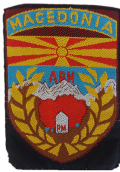
сл./ fig. 14

Амблемот на Стационарниот јазол за врски „Водно“ е во форма на штит во темносина боја, со димензии 7,1 x 9,5 см. На амблемот е испечатено „Р. МАКЕДОНИЈА“, подвлечено со светлоцрвена линија којашто формира правоаголник со димензии 6,3 x 1 см. Во средината на амблемот е испечатена контура на територијата на РМ со димензии 5,5 x 4 см, во којашто се наоѓа знамето на РМ. Над сончевиот диск е претставена комуникациска кула – предавател во црна боја со димензии 1,6 x 2,3 см, околу којашто со жол-