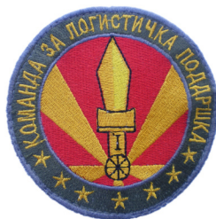
сл./ fig. 27

In anticipation of the 20th anniversary of the ARM, besides the new uniform for the guard unit and the new digital military-field uniform for the Army members, on 9 July 2012 the President of the Republic of Macedonia signed the third Regulation on Unique Insignia for ARM membership, the uniform, rank insignias, arm and service insignias, the unit insignias, as well as the manner and circumstances for their use (Official Gazette, 2012). This regulation introduced new insignias for nearly all commands and units of the ARM in accordance with the new formation-organization structure and it described in details the manner