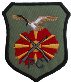
сл./ fig. 37

the words “КОМАНДА ЗА ОБУКА И ДОКТРИНИ” (TRAINING AND DOCTRINES COMMAND) in a semicircular yellow shape. The second circle is green, in which a shield depicts the state flag. To the shield’s right is an open book, while on the shield are a crossed torch and a sword, whose grip is on the open book. (Fig.