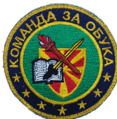
сл./ fig. 27