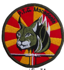
сл./ fig. 34