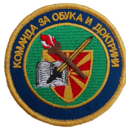
сл./ fig. 35

На 12 октомври 2016 година, Претседателот на РМ ја потпиша четвртата Уредба за единствениот знак за припадност на Армијата на Република Македонија, уни-