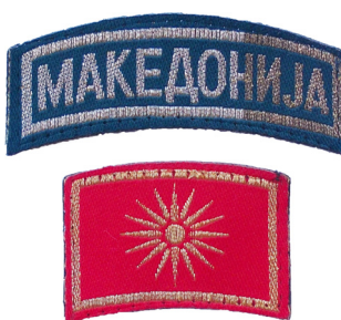
сл./ fig. 7

membership insignia), and the flag of the Republic of Macedonia.