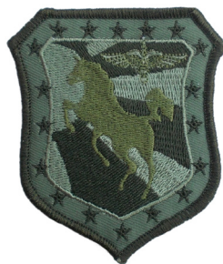
сл./ fig. 33