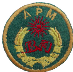
сл./ fig. 9

Покрај овој амблем што се носи на ракавот, дизајниран е и амблем на Воената академија за капа, во форма на круг со зелена боја со дијаметар 5 см. Во средината, со црвен конец се извезени буквите „ВА“, околу нив е извезен венец од житно класје во темножолта и светложолта боја, обвиткан со лента на долните краеве, а меѓу врвовите на класјето е 16-кракото сонце од државното знаме, извезено во црвена боја. Над сонцето со црвен конец е извезено „АРМ“. По целата должина, амблемот е обрабен со раб во темножолта боја, широк 0,3 см. (сл. 9)