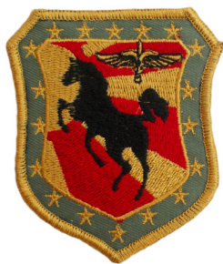
сл./ fig. 32