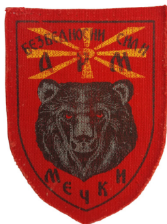
сл./ fig. 19