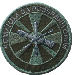
сл./ fig. 42

Macedonia signed the Regulation on Unique insignias for ARM membership, uniforms, rank insignias, arm and services insignias, ARM units insignias as well as the manner and conditions for their use (Official Gazette, 2016). The new regulation describes the new collar insignias for first and main non-commissioned officers in ARM commands and units, which for the first time were given officially to the Chief of the General Staff of the ARM during the annual conference of the main non-commissioned officers of the ARM at the Army House on 23 December 2016. The Regulation describes for the first time the metal badges worn on the hats by the members of the “Волци” (Wolves) Special Forces Battalion and the Ranger Battalion, from the Special Operations Regiment. It also describes the new emblems of the Tank Battalion from the 1.MIB and the Reserve Forces Command.