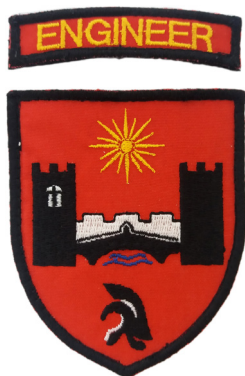
сл./ fig. 20,21