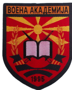
сл./ fig. 11

На 16 јуни 2000 година е основана Граничната бригада на АРМ. Амблемот на Бригадата е во форма на штит со кафеава боја, со димензии 9,5 x 7,5 cm. На горниот дел на полукружна лента, со светлосина боја со жолти букви е исткаено „MACEDONIA“, под неа е исткаено знамето на РМ, а под него, централно е претставена контура на територијата на РМ во црвена боја, врз којашто е исткаен граничен камен во бела боја со натпис „РМ“. Над контурата се исткаени планински врвови во бела и кафеава боја и небо во свет-