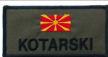
сл./ fig. 44

The flag of the Republic of Macedonia in 1992–2018 appears in a total of 43 different em-