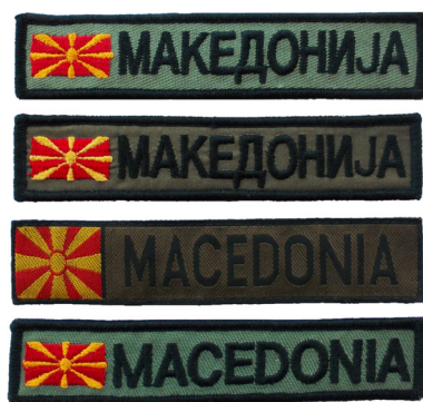
сл./ fig. 44

Знамето на Република Македонија, во периодот 1992 – 2018 година, е застапено на вкупно 43 различни амблеми на АРМ. Како самостоен амблем е изработено во шест дизајни – како прв амблем на АРМ во мај 1992 година, печатен на