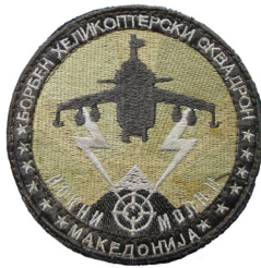
сл./ fig. 24

yellow sun. Around the emblem is a black fimbriation, 0.3 cm wide. (Fig. 20)