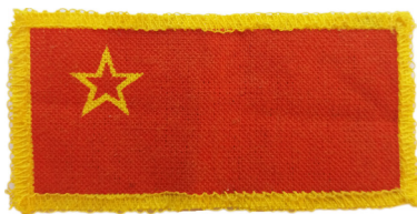
сл./ fig. 2

On 11 August 1992 the Parliament of the Republic of Macedonia adopted the Law on the Flag of the Republic of Macedonia, which established the new state flag—a 16-rayed yellow sun (Sun of Kutleš) on red background with proportions of 1:2. On 8 October 1992, the President of the Republic of Macedonia signed the Regulation on ARM member insignia (Official Gazette 1992), that prescribed three insignias—an emblem with the coat of arms of the Republic of Macedonia and the inscription “ARMY OF THE REPUBLIC OF MACEDONIA” around it, with a diameter of 66 mm (the Regulation defines it as the only insignia for Army membership), then the cap emblem in a shape of a sunflower with 12 leaves (that actually later became the only army