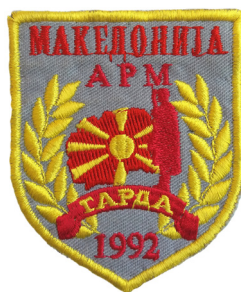
сл./ fig. 13

The new emblem of the Military Academy is a dark red shield with dimensions of 6.5 x 8.2 cm. 5 mm above the upper edge a horizontal line forms a rectangle with dimensions of 0.8 x 5.9 cm, enclosing the words “ВОЕНА АКАДЕМИЈА” (MILITARY ACADEMY) are woven in black on an orange background. Below the rectangle, the state flag with dimensions of 2.5 x 6 cm is woven, and below it are a centered open white book on crossed black guns and a sword. To the left and right of the book is woven a wreath made of dark yellow sheaves of wheat, with the bottom ends wrapped by a dark blue three-layer ribbon. Below the ribbon, the year “1995” is woven in black. The central symbol covers the sun rays of the state flag. Around the emblem, 0.3 cm from the external edge, a dark blue ribbon is woven that forms an inside frame. (Fig. 11) The emblem of the Military Academy is also made in embroidered version. (Fig. 12)