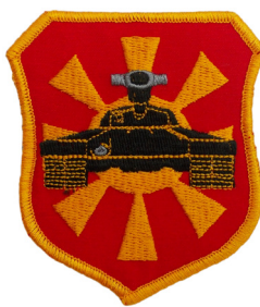
сл./ fig. 39

Знамето на Република Македонија со димензии 2,5 x 1,4 см е извезено и на ознаките со натпис „МАКЕДОНИЈА“ и „MACEDONIA“, коишто се во форма на правоаголник со димензии 13 x 2,8 см и се носат на предната лева страна на воено-теренската униформа (сл. 43). Државното знаме, исто така, со димензии 3,1 x 1,1 см е извезено и на ознаките за презиме (11 x 5,5 см), коишто ги