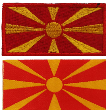
сл./ fig. 10

Новиот амблем на Воената академија е во форма на штит со темноцрвена боја, со димензии 6,5 x 8,2 см. На 5 мм од горниот раб е исткаена хоризонтална линија којашто формира правоаголник со димензии 5,9 x 0,8 см, во чијашто внатрешност, на портокалова основа со црни букви е исткаено „ВОЕНА АКАДЕМИЈА“. Под