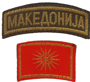
сл./ fig. 5