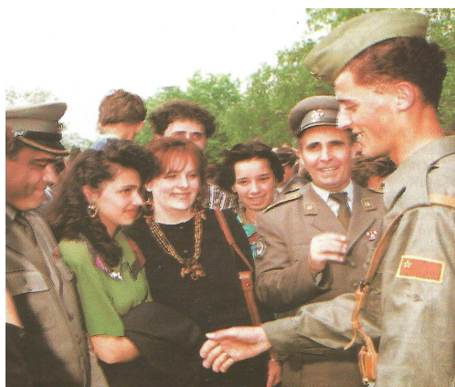
сл./ fig. 1

March 1992 when the last soldier of the Yugoslav People's Army (YPA) left Macedonian territory. In the meantime, from 11 to 26 March members of the Territorial Defense (TD) of the Republic of Macedonia took over all military objectives—barracks, blockhouses, and buildings of the Army—and on 14/15 April the first recruits started joining the Army.