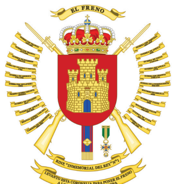
Грб на 1-виот кралски почесен пешадиски полк / CoA of the 1st King's Immemorial Infantry Regiment