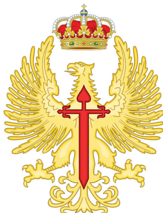
Бец на шпанската армија / Badge of the Spanish army

име на единицата. Дополнително на него можат да се прикажат и добиени одликувања. Содржината на штитот е разновидна и зависи од видот, родот, службата, историјата или пак локацијата на дадена единица. Па така, грбовите на регионалните команди во себе содржат значаен дел од грбот на местото на нивната постојана дислокација. Делови од месно – хералдички грбови се среќаваат и на други помали единици. Особено интересно е тоа што единиците на шпанскиот легион користат и лични грбови како дел од своето хералдичко достигнување. 3 Сепак, може да се каже дека најголем дел од грбовите содржат воена амблематика. 4 Тука пред сè можат да се набројат разноразни оружја, делови од оклоп, тврдини и фортификациски елементи па дури и современи машини како булдожери, тенкови, радары итн. Животинските мотиви се исто така застапени, но во нешто помал број. И покрај богатството од грбови и длабока традиција, постои евидентна неправилност