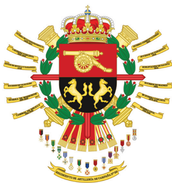
Грб на 20-ти артилериски полк / CoA of the 20th Field Artillery Regiment

The Spanish military insignias can be basically divided into two major groups: in the first one are the heraldic Coats of Arms and in the second the heraldic badges. Every unit of the army the size of battalion or larger has the right of its own Coat of Arms. The Coats of Arms represent a complex heraldic achievement which depict the history and achievements of each armiger unit. The Coats of Arms can be found in two different versions; such as lesser Coat of Arms comprised of only a shield, and a greater Coat of Arms with additional attributes. The lesser version finds its main use on the military uniforms of the army and the greater version is used in official and ceremonial occasions. The greater version of the Coat of Arms is comprised of a shield, attributes, crown and the name of