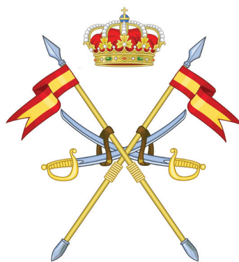
Бец на шпанската коњаница / Badge of the cavalry of the Spanish army

Сè на сè шпанската воено – хералдичка пракса и многувековно искуство се исклучителен позитивен пример за тоа како се негува воената традиција и слава. Останува само да се надеваме дека и нашата армија ќе смогне сили и ќе се угледа на овој светол пример, па конечно ќе се воведи логика и ред во хаосот на нашите воени ознаки. ■