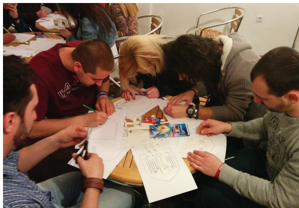
Хералдичка работилница во организацијата „Секој студент“ / Heraldry workshop at the premises of „Sekoj student“