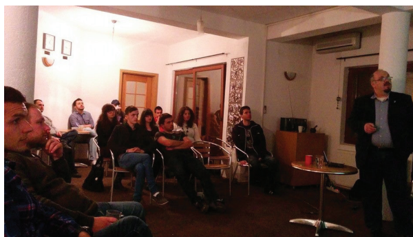
Предавање за хералдика во организацијата „Секој студент“ / Lecture at the premises of „Sekoj student“