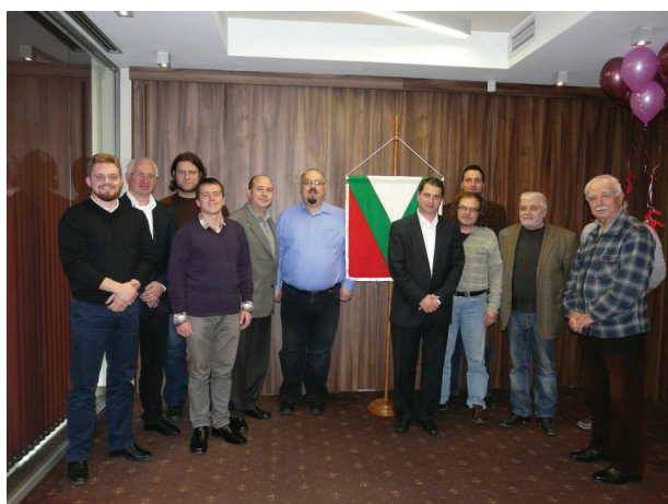
Делегација на МХЗ на годишното собрание на Бугарското Хералдичко и Вексиллошко Здружение / A delegation of MHS at the assembly of the Bulgarian Heraldry and Vexillology Society