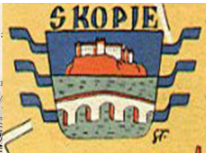
сл. 8 fig. ~1955