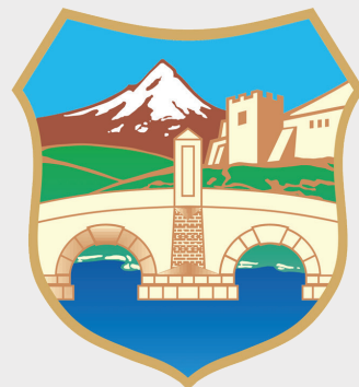
сл. 16 fig. 2006