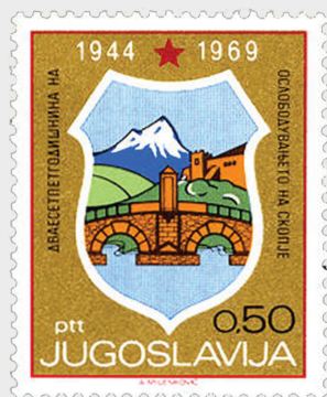
сл. 12 fig. 1969