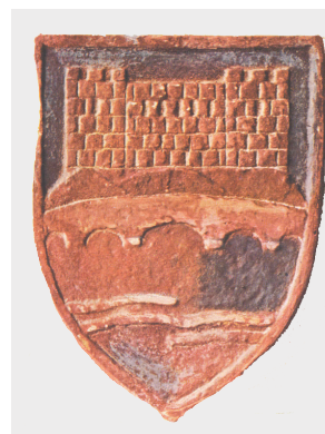
сл. 9 fig. 1965

Proposal by world renowned heraldic artist, Aleksandar Kurov, Germany, 2006. fig. 14