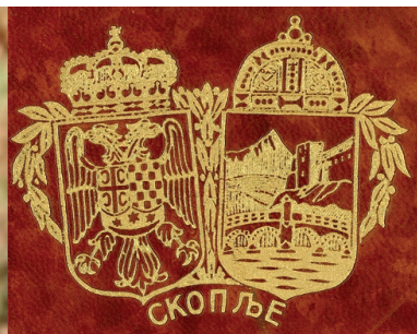
сл. 5 fig. 1933