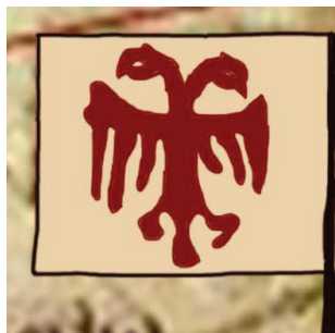
сл. 4 fig. 1339