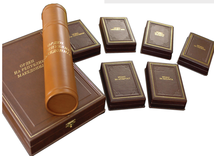
Кутиите за ордените и медалите/ The Boxes of the orders and medals

The Macedonian order system was conceived and partly realized modeled on European standards established by Napoleon Bonaparte. It consists of a system of grading of the orders in five ranks, and rules on how to wear the badge, its miniature or the small ribbon in various situations and so on.