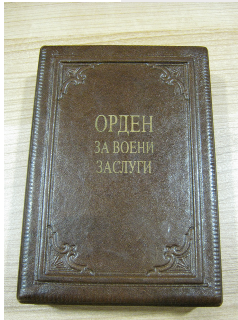
Кутијата за орденот на воени заслуги/ The box of the Order for Military Merit

The Charter for granting the highest State order has dimensions of 32 by 45 cm. It is made of parchment paper with light blue and purple ornaments and a pale yellowish-white background. On the upper third the contour of the order star is applied in the original pattern and color. A dry or wax seal is not present; instead, a longitudinal application of a red and yellow ribbon with a red circle in the middle is printed, in the form of a wax seal in which the Arms of the Republic of Macedonia is present. Around it there is a white letter inscription “Republic of Macedonia - President of the Republic of Macedonia.”