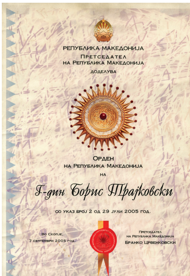
Указот за доделување на Орден на Република Македонија на Борис Трајковски/ Decree for decorating Boris Trajkovski with the Order of the Republic of Macedonia

Придружните елементи на сите државни одличја во светот се нешто без коешто приказната за ордените и медалите е далеку од целосна. Позната е фалеристичката реченица „Орденот е комплетен – има кутија, указ и минијатура“.