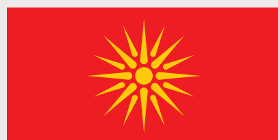
Знамето на Република Македонија (1992 - 1995) / Flag of the Republic of Macedonia (1992 - 1995)