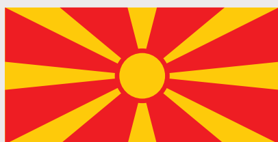
Знамето на Република Македонија (1995 - сега) / Flag of the Republic of Macedonia (1995 - now)