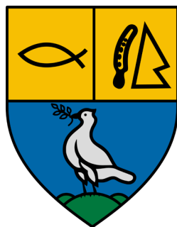
сл./ fig. 14

Како и да е, повеќеденоминациските цркви не се само производ на хералдичката замисла: во Сатта (сл. 15) (и неговиот грб) има поранешна пожарникарна станица, пренаменета во екуменска капела и посветена за-