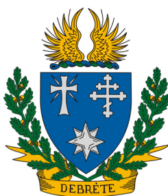
сл./ fig. 3

ташш, Палхаз). Осум грба прикажуваат гркокатолички цркви со двоен (пр. Каллошемјен) или троен (пр. Филкехаза) крст. Кај грбот на Халастелек има индиректна индикација на гркокатолицизам – слика на Св. Ладислав, патрон на месната гркокатоличка парохија.