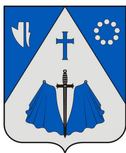
сл./ fig. 2

за разлика од калвинистите, втората најголема верска група, која е симболизирана од ѕвезда (cf. 4.1.3.). Крстовите не само што ги украсуваат куполите на црквите или претставуваат литургиски предмети, тие може исто така да бидат самостојни споменици, како тој што е подигнат на брдото за време на Контрареформацијата и којшто е прикажан на грбот на Урпоњ.