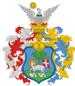
сл./ fig. 6

Пеликан што се ранува себеси на градите за да ги нахрани своите пилиња е популарен мотив во унгарската хералдика (присутен кај повеќе од 30 грба). Исто како Јагнето Господово,