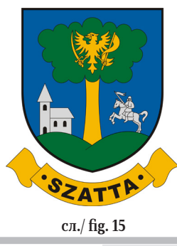
сл./ fig. 15

However, multid denominational churches are not only products of heraldists’ imagination: in Szatva (Fig. 15) (and its coat of arms), there is a former fire-station converted into an ecumenical chapel and consecrated jointly by