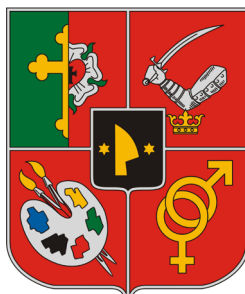
сл./ fig. 10

star is the clearest example, but the symbols may also be shown crossed (Rádóckölked), put on each other (Bi-harkeresztés) or held by the mythical turul bird (Márokföld).