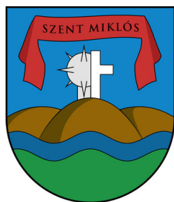
сл./ fig. 8

Мартин Лутер, во неговиот опис на овој „симбол на неговата теологија“ од 1530, дал посебен нагласок на значењето на боите (на пример, тој напишал дека розата – симбол на радост, спокој и мир – „треба да биде бела, а не црвена, бидејќи белата е бојата на духовите и ангелите“ (Кнааке 934, 445)). Сепак, во повеќето од анализираниите описи, бројот на боите е намален (што е разбир-ливо во хералдиката) до тој степен што во четири случаи (пр. Менде), Луте-ранската роза станала монохроматска. Во анализираниите грбови, крстот не е секогаш црн, туку понекогаш е бел (пр. Морицхида) или жолт (пр. Кашканку); позадината се појавува во суштина во секоја боја (во случајот со Вадосфа, каде Лутеровата роза формира круна, нема воопшто позадина), а розата може да биде жолта (Рабасентандраш). Само една третина од анализираниите описи се