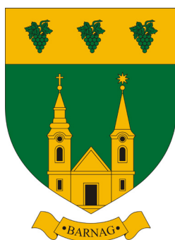
сл./ fig. 7

Three coats of arms show bidenominational churches which do not exist in reality and are marked with both the Catholic cross and the Calvinist star (Barnag (Fig. 7), Garé, Pálfiszeg). There are a lot of coats of arms that show both these symbols (often together with other denominational symbols) and place them next to each other, but four coats of arms are special as they feature them closely connected. The coat of arms of Tápszentmiklós (Fig. 8) with its hybrid symbol of half-cross, half-