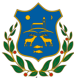
сл./ fig. 16

Denominational motifs appear on about 35% of the coats of arms of Hungarian cities, towns, and villages. On some of the coats of arms, the motifs were employed with a clear intention to represent a particular religious group: the Eastern Orthodox cross always stands for Greek Catholic or Eastern Orthodox Christians, the complex motif of the Luther rose is unequivocally Lutheran, and church silhouettes (often reduced to their steeples and usually adorned with a distinctive symbol) as a rule represent particular denominations. In other cases, denominational interpretations were added later, to already existing coats of arms featuring some more ambiguous symbols, such as the star, which is a very popular motif in Hungarian heraldry. Although originally derived from pre-heraldic seals (Znamierowski 2017, 461), the star is often interpreted as a Calvinist symbol. However, it is worth noting that in many instances this association is fully justified, e.g., when the star is juxtaposed with