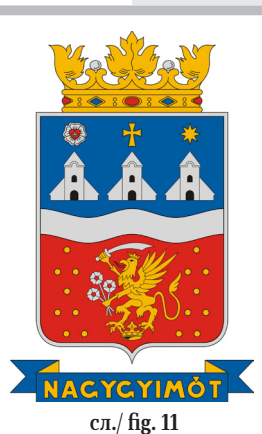
сл./ fig. 11

Друг популарен елемент што ги претставува лутераните е црква (понекогаш само кула), во повеќето од случаите (22 од 32) со крст. Вообичаено е едноставен латински крст (пр. Наѓчеркес), но може да има некои дополнителни особини, како што се зраци меѓу краците (Наѓхајмаш), концентрични кругови и петел (Харка) или дополнителни краци (Киштормаш, Вањола). Други можни декорации на лутеранските цркви вклучуваат ѕвезди (Апоштаг, Чомад) и топки. На грбот на Наѓѓимот (сл. 11), три деноминациски симболи (лутеранска роза, крст и калвиснистичка ѕвезда) се поставени над три идентични цркви со „голи“ кули. Кај тој на Лајошкомаром, кулите на трите цркви (со католички двоен крст, лутерански обичен латински крст и Реформирани ѕвезда) не само што се високостилизирани и идентични, туку и споени една со друга.