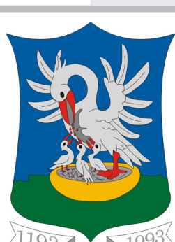
сл./ fig. 13

garian heraldry it tends to commemorate struggles against the Ottoman Empire, as is the case with the coat of arms of Pustamagyaród (Fig. 12), which shows a cross and a crescent, both burning.