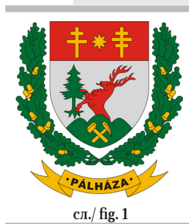
сл./ fig. 1

In the religious context, this symbol is thus associated with both the Christian East and West. This ambiguity has been used in the