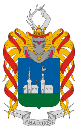
сл./ fig. 4

On more than 20 coats of arms, the Reformed church is represented by a chalice. This vessel is used in all Christian churches, but as a symbol identifying a particular denomina-