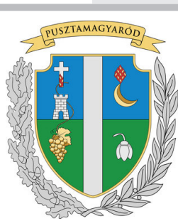
сл./ fig. 12