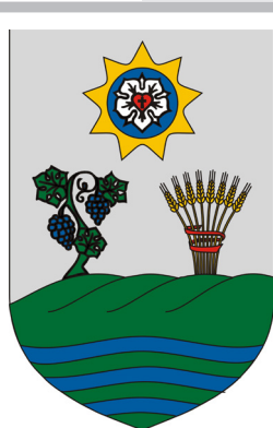
сл./ fig. 9