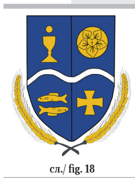
сл./ fig. 18

other denominational symbols, a fairly frequent practice.