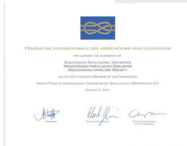
Потврдата за членство во ФИАВ, Меѓународната федерација на вексилолошки здруженија / Certificate for Membership in FIAV, International Federation of Vexillologic Associations