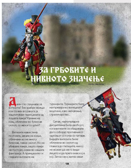
Напис за хералдиката во детското списание „Кладенче“ / Article on Heraldry in the children’s magazine “Kladenche”