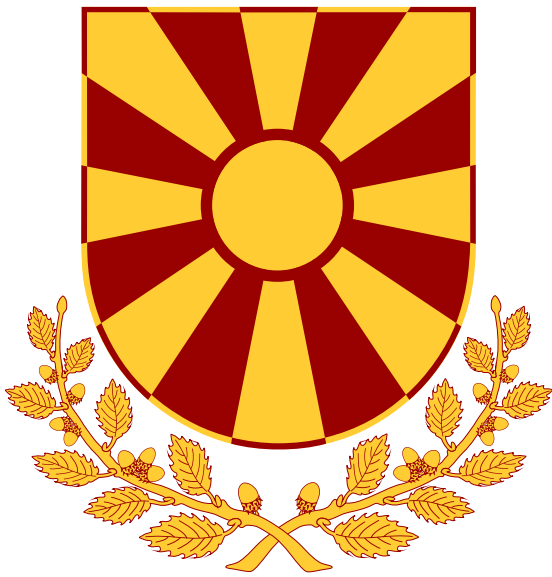
Грбот на претседателот Coat of Arms of the President

Минатата година беше мошне плодна за Македонското хералдичко здружение, (МХЗ): Два од трите грба на важни институции се блазонирани од страна на Македонското хералдичко здружение: Грбовите на претседателот на Република Македонија и на Македонската Православна Црква. За жал, оној најважниот, грбот на Република Македонија беше донесен без консултација со МХЗ. Стр 3