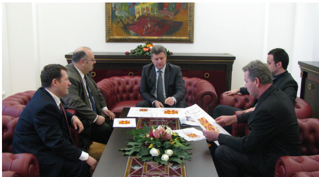
Авторите од МХЗ на работна средба со претседателот The authors of MHS on working meeting with the President