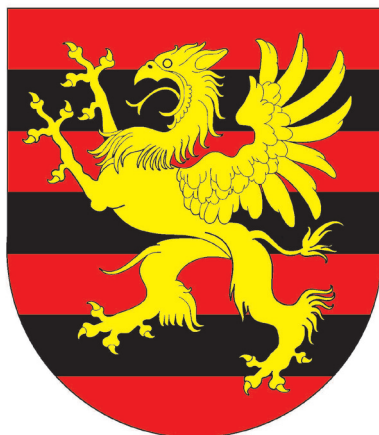
Првичниот предлог The initial proposal

Третата група ја претставуваат земји кои имаат модификувано знаме за претседателот. Тука спаѓа Хрватска кај која на претседателското знаме е претставена модификација на државниот грб. Претседателот на Хрватска самиот ваков модификуван грб го користи како грб на претседателот.