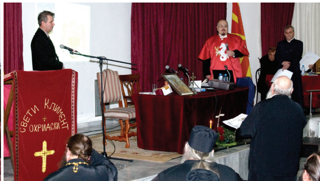
Авторите од МХЗ на црковно-народниот собор The authors of MHS on Ecclesiastic-laity Assembly

Минатата година беше мошне плодна за Македонското хералдичко здружение (МХЗ). Два од трите грба на важни институции се блазонирани од страна на Македонското хералдичко здружение: грбовите на претседателот на Република Македонија и на Македонската православна црква. За жал, оној најважниот, грбот на Република Македонија, беше донесен без консултација со МХЗ.