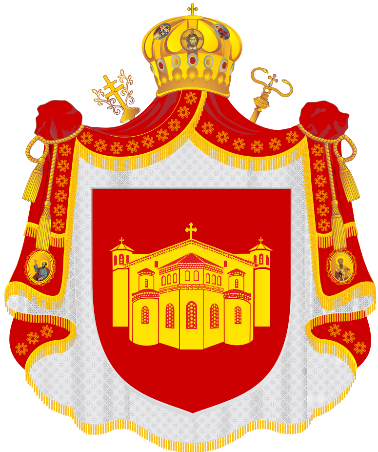
Грбот на МПЦ

Минатата година беше мошне плодна за Македонското хералдичко здружение, (МХЗ): Два од трите грба на важни институции се блазонирани од страна на Македонското хералдичко здружение: Грбовите на претседателот на Република Македонија и на Македонската Православна Црква. За жал, оној најважниот, грбот на Република Македонија беше донесен без консултација со МХЗ. Стр 3