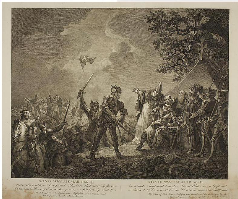
“Dannebrog паѓа од небото” - К.А.Лоренцен, 1809 / “Dannebrog falling from the sky” - C.A.Lorentzen, 1809