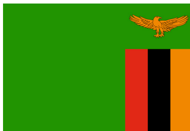
Зелената боја како симбол на зеленлото во државата - знамето на Замбија / The green colour as a symbol of the green land in the country - the flag of Zambia

Со прегледот погоре за симболиката на боите на знамињата на африканските држави коишто имаат визуелна симболизација на некоја природна или географска карактеристика, тематиката е релативно појасна и полесно може да се класифицира. Јасно и лесно воочливи се елементите и симболиката на знамињата, а со тоа и идеите што тие ги претставуваат. Подлабоко и поопширно е анализирањето на историјатот на знамињата, односно зошто и како нацртите