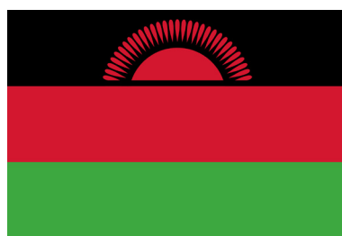
Знамето на Малави е исто така одличен пример за употреба на боите од панафриканското знаме /The flag of Malawi is also an excellent example about the use of the colours of the Pan-African flag

The phenomenon of non-national (i.e., non-ethnic states) is closely related to the colonial period. The newly created states inherited their state borders from the colonial period, leaving them with a mixed ethnic character. The absence (in most cases) of single-ethnicity national states on the African continent, and in particular among the 40 countries analysed in this review, also directly influenced the choice of national symbols. Due to the lack of a dominant majority ethnic group (though there are some exceptions, such as Botswana 48 ), post-colonial states tried to adopt new national symbols that did not represent a single ethnicity.