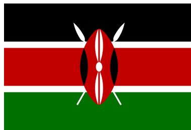
Знамето на Кенија е еден од најрепрезентативните примери за употреба на панафрикански бои /The flag of Kenya is one of the most representative example of the use of Pan-African colours

Тесно поврзано со колонијалниот период е и феноменот на ненационални, односно неетнички држави. Новосоздадените држави, своите државни граници ги наследиле од колонијалниот период, а со тоа и мешаниот етнички карактер на државите. Непостоењето (во голем дел) ненационални етнички држави на африканскиот континент, а особено меѓу 40-те анализирани во овој преглед, исто така директно влијаело врз изборот на национални симболи. Поради непостоењето доминантно мнозинска етничка група (со исклучок на одделни држави како што е Боцвана на пример 48 ), државите при процесот на усвојување на новите национални симболи имале тенденција да усвојуваат симболи коишто не претставуваат етнички симбол или етничко знаме. Предводени од идеологијата за единство и солидарност со сите постколонијални нации, државите создавале знамиња коишто ќе бидат обединувачки симбол за сите етнички групи во државата. Избегнувањето симболи на само една етничка група довело до создавање на денешните дизајни, коишто, да напоменеме повторно, немаат етничка симболика, туку се предводеле (во најголем дел) од идеологиите на панафриканската солидарност и единство. Поради тоа, сличниот или ист број бои со иста или слична симболика можат да се пронајдат кај држави од сите региони од Африка, често и кај држави коишто немаат соседска блискост и непосредна социо-политичка комуникација.