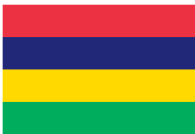
Знамето на Маврициус има четири еднакви ленти со четири различни бои. Две симболизираат некоја природна карактеристика на државата / The flag of Mauritius is made of four equal stripes in four different colours. Two symbolise a natural feature of the country

The African continent today comprises 54 independent countries, all with well-established national symbols. The analysis of the African flags for this review focuses on the symbolism of the colours on the flags—more precisely, in what manner and to what degree natural abundance and geographical characteristics are represented vexillographically on these post-colonial African flags. According to this research, 40 out of 54 state flags in Africa have a colour that symbolises natural abundance in some form. Additionally, the same colours