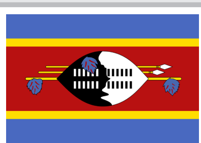
Плодната почва во Есватини е претставена со црвена боја на знамето на државата / The fertile land in Eswatini is represented by red on the country's flag

to the fact that this colour 'is reserved' as a symbol of the struggle of the people for liberty (Angola, Macedonia, Latvia, etc.)