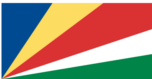
Знамето на Сејшели е составено од пет бои, од кои три имаат симболика на некоја природна карактеристика на земјата / The flag of the Seychelles is made of five colours, of which three symbolise a certain natural feature