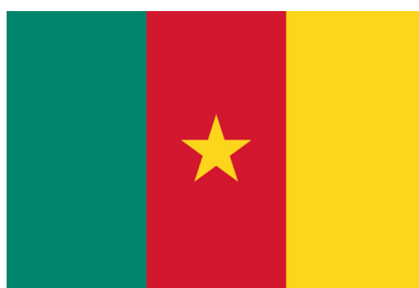
Жолтата боја на знамето на Камерун симболизира две природни карактеристики / There is a double meaning to the yellow colour on the flag of Cameroon

Yellow is used on the flags of: Benin, Cameroon, Democratic Republic of the Congo, Gabon, Guinea, Guinea-Bissau, Eswatini (Swaziland), Mozambique, Sao Tome and Principe, Tanzania, Togo, and Zimbabwe. Yellow symbolizes different natural resources, depending on what the country or the people give larger significance to. This colour may symbolize geographical regions, mineral resources, and even astronomical objects. Official descriptions of the flags show that yellow symbolizes the natural treasures