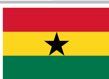
Златната боја како симбол на рудното богатство на државата на знамето на Гана / Golden color on the flag of Ghana, as symbol of the mineral richness of the stater

Како и со случајот со жолтата, така и кај златната боја, симболиката е слична скоро кај сите знамиња. Златната боја кај овие анализирани африкански знамиња најчесто претставува симбол на рудното богатство на државата (Гана 15 , Мали 16 ) и пустината како доминантна географска карактеристика на државата (Чад 17 и Мавританија 18 , каде јасно е посочена Сахара). На златната боја од знамето на Чад ѝ се припишуваат две значења, односно сонцето (астрономски објект) и пустината. Како што може да се забележи од овој преглед, симболиката што ја претставува златната боја е мошне слична со симболиката на жолтата боја, односно двете бои ја имаат улогата