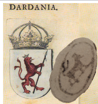
Грбот на Дарданија кај Витезовиќ (1741), заедно со деталот од грбот на Карловачката митрополија / The Arms of Dardania in Vitezović (1741), alongside the detail from the Arms of the Metropolitanate of Karlovci

(1) Arms we have no information. It is the Bosnian Roll of Arms of Palinić. For twenty-five (25) Arms we have knowledge of the colors. It should immediately be said that twenty-four (24) Arms are divided into two groups, one group of Arms containing a Gules lion Or, and Or lion Gules. Only one (1) Arms deviate from these combinations, having Gules lion Argent. It is the Belgrade Roll of Arms of 1640.