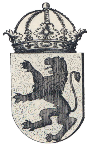
Македонскиот грб според Жефаровиќ (1741) / The Macedonian Arms by Žefarović (1701)

треба одговорно и свесно да прифатиме дека не постои јасен победник помеѓу двете основни верзии на македонски грбови со лав. Прогласувањето на едниот за „помакедонски“ од другиот е невозможно од научна гледна точка. Што се однесува до изборот на едната или другата варијанта за државен грб, треба да бидеме свесни дека таквиот чекор бара прагматизам и усогласување не само со основните хералдички правила туку и со правилата за каденција, т.е. односот на нашиот потенцијален грб со другите државни грбови. Хералдиката како универзален систем го наложува тоа, без разлика дали нам ни се допаѓа или не. ■