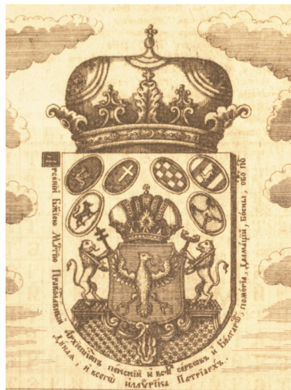
Грбот на Карловачката митрополија, во кој се наоѓа грбот на Дарданија (прва колона, втор ред), кај Матковски погрешно идентификуван како грб на Македонија / The Arms of the Metropolitanate of Karlovci, on which the Arms of Dardania is found (first column, second row), wrongly identified as the Arms of Macedonia by Matkkovski

Грбовите со златен лав на црвено поле, за свој најран претставник го имаат грбот од грбовникот Корениќ - Неорик. Грбовите со црвен лав на златно поле како свој најран претставник меѓу илирските грбовници го имаат делото „Кралството на Словените“ на Мавро Орбини 25 . Оваа книга е црно-бела, т.е. на грбовите не се користени никакви ознаки за бои. Во книгата на Орбини, македонскиот