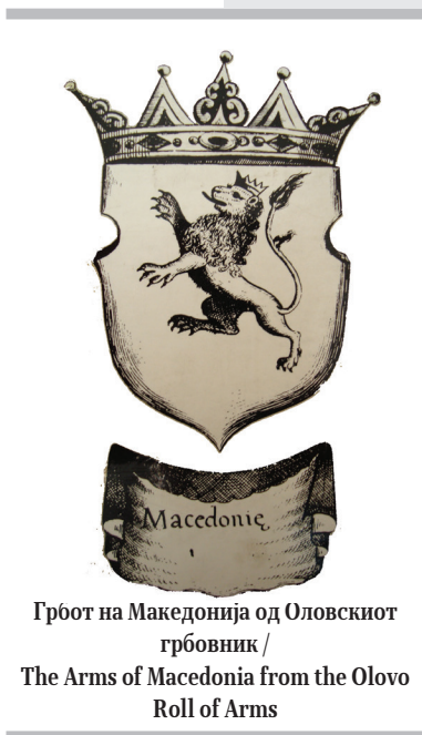
Грбот на Македонија од Оловскиот грбовник / The Arms of Macedonia from the Olovo Roll of Arms