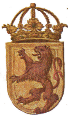
Македонскиот грб во ракописниот грбовник на Витезовиќ (1694) / The Macedonian Arms in Vitezović's manuscript (1694)