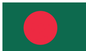
Бангладеш / Bangladesh

the illumination of the sun is in the style of the rays. With the sun in splendor, pictorial rays are designed, where every odd ray is linear and every even ray is wavy. In addition, the disc from the sun can, but doesn't have to be stylishly designed with given human traits. The sun in illumination