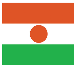
Нигер / Niger