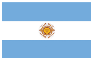
Аргентина / Argentina