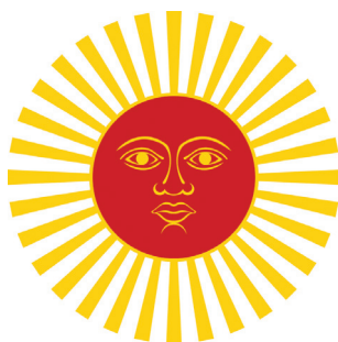
Мајското сонце / The Sun of May

Bolivia. The sun is considered the beginning of a new era in the history of these countries, and this is often followed by the legend of Argentina which says that while the new government was being established for an independent Argentina, the sun has strongly illuminated the scene from behind the clouds. There are theories that the „Sun of May“ originates from the symbol for the sun god, Inti, who was one of the supreme gods of the Incas. Similar symbols are assigned to the sun of the flags of Antigua and Barbuda,